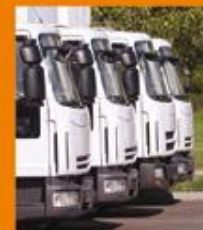
Flota y Vehículos de Empresa