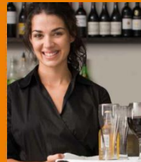
Comercios y Oficinas