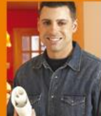
Colectivos Accidentes / Vida