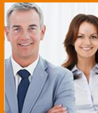
Responsabilidad para D&O